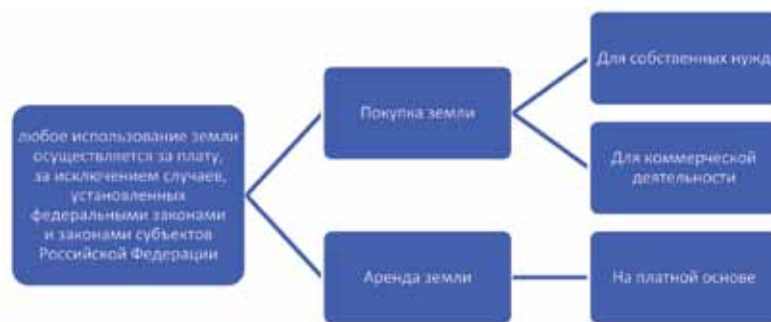
Рис. 5. Платность использования земли в рамках управления проектами

В условиях формирования эффективного конкурентоспособного рынка государство обязано обеспечить экономическую безопасность и защитить права и свободы человека и гражданина, которые являются высшей ценностью. Земельные участки должны быть использованы эффективно и плата за использование земли должна быть соответствующая. На рис. 5 схематично представлена платность земли или земельного участка. В последние годы при формировании Стратегии развития муниципальных образований во многих регионах происходят процессы, которые отклоняются от требований Конституции. То есть нарушается статья 3 Конституции, которая гласит: «Носителем суверенитета и единственным источником