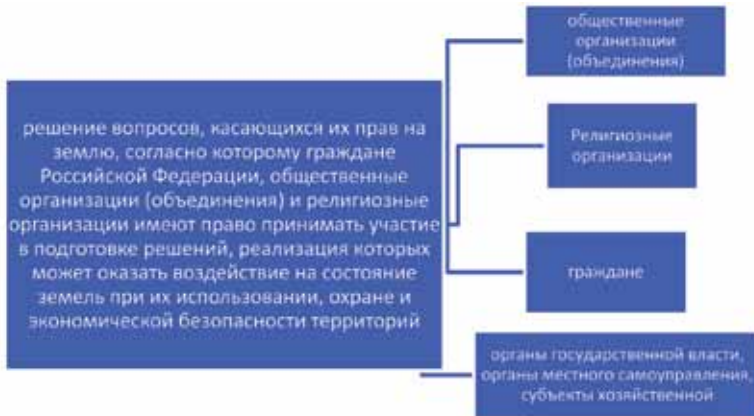
Рис. 4. Участие в решении земельных вопросов в рамках управления проектами