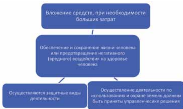
Рис. 3. Приоритеты охраны жизни и здоровья человека

муниципальных и других жилищных фондов в соответствии с установленными законами нормами. Однако, как показывает опыт, комплексное планирование муниципальных образований оставляет желать лучшего и нет концепции решения многих социальных проблем, отражающие приоритетные направления по обеспечению охраны жизни и здоровья населения. На рис. 3 отражены приоритеты охраны жизни и здоровья населения в рамках управления проектами. Управление проектами в настоящее время принимает сложные механизмы в реализации и продвижении проектов. Разработчикам проектов приходится планировать не только земельные и имущественные отношения в рамках муниципального образования, но формировать налоговую политику, соблюдать и выполнять требования налогового законодательства, уплачивать законно установленные налоги и сборы и