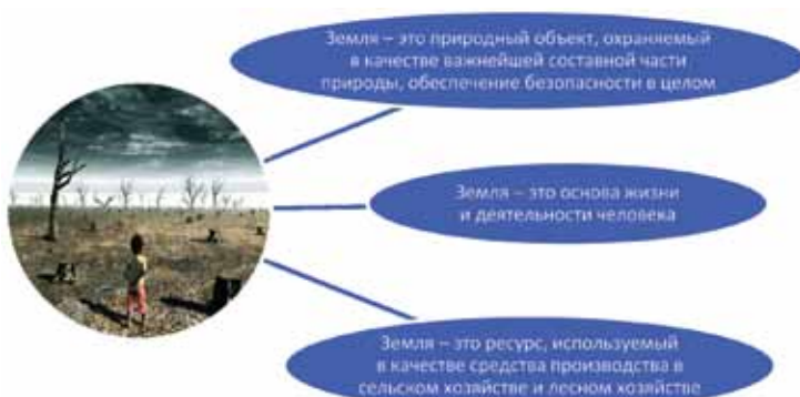
Рис. 1. Основные принципы земельного законодательства в рамках управления инновационными проектами

Управление инновационными проектами и обеспечение экономической безопасности в первую очередь требует особого мониторинга земельных отношений и анализа как муниципального, регионального, так и федерального долгосрочного планирования экономики. На рис. 1 приведены принципы земельного законодательства, которые в рамках развития цивилизации должны быть инновационно переосмыслены.