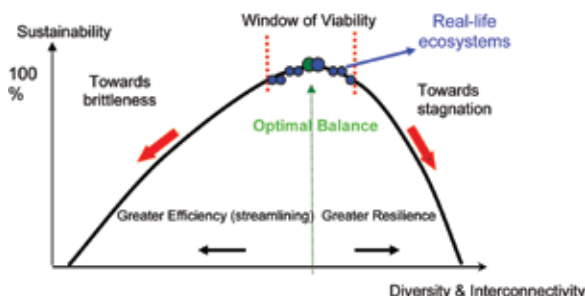
Рис. 2. «Окно жизнеспособности», в пределах которого функционируют все природные экосистемы. Сложные природные экосистемы неизменно функционируют в узких пределах по обе стороны от точки оптимума

Как указывалось выше, примечателен тот факт, что у экосистем критические величины параметров находятся в весьма специфических и относительно узких пределах, которые мы назвали «окнами жизнестойкости» и которые можно достаточно точно определить расчетом (рис. 2).