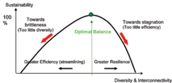
Рис. 1. Кривая длительной устойчивости, построенная между двух полярностей: эффективностью и гибкостью. Природа отбирает не по максимуму эффективности, а по оптимальному балансу между указанными полярностями. Обратите внимание на то, что гибкость почти в два раза более важна, чем эффективность

Sustainability – Длительная устойчивость Towards brittleness (too little diversity) – К хрупкости (недостаточно разнообразия) Optional Balance – Оптимальный баланс Towards stagnation (too little efficiency) – К стагнации (недостаточно эффективности) Greater efficiency (streamlining) – Более высокая эффективность (налаженность) Greater resilience – Более высокая гибкость Diversity & Interconnectivity – Разнообразие и взаимосвязанность