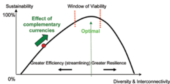
Рис. 5. Влияние различных дополнительных валют. Функционирование дополнительных валют различных типов дает возможность экономике начать движение к большей длительной устойчивости (толстая стрелка, движение вверх). Хотя этот процесс явно уменьшает эффективность, он целесообразен ввиду увеличения гибкости системы. Дополнительная валюта способствует осуществлению сделок, которые при ее отсутствии были бы невозможны, объединяет ресурсы, которые не были бы использованы, поощряет многообразие связей, которых в противном случае не было бы

Традиционное экономическое мышление предполагает, что «де факто» монополия национальной денежной системы – нечто неоспоримое. Природа же преподносит нам логический урок, объясняя, что для обеспечения длительной финансовой устойчивости необходима диверсификация валютных систем с тем, чтобы возникало и работало как можно больше разнообразных субъектов и каналов, по которым осуществляется движение и обмен денег (рис. 5).