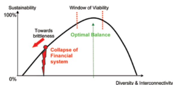
Рис. 4. Динамика искусственно усиливаемой монокультуры валют и банков в сложной системе, где только эффективность считается достойной внимания. Выходом может быть только системный финансовый кризис

Чрезмерно эффективная система, подобная показанной на рис. 3, – это «ожидание чрезвычайного происшествия», ситуация, обреченная на крах и разрушение, сколько бы времени и героических усилий не тратили уважаемые люди в попытках ее сохранения. Графически это представлено на рис. 4.