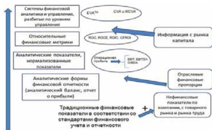
Рис. 1. Направления развития финансовой аналитики

Added), показатель CerTIVVA (Certification, Testing, Inspection & Verification – Value Added), который применяется банковской группой Societe Generale de Surveillance (SGS) 1 . Новые финансовые показатели «выстраиваются в пирамиду» по уровням управления и бизнес-единицам, ставят целью показать создаваемые эффекты для владельцев капитала в разные временные отрезки. Проверка показателей на «качество их работы» – корреляция с фиксируемой по биржевым котировкам рыночной стоимостью компании (акций). Именно рыночная стоимость компании (ее акционерного капитала и акций) ставится во главу угла. Каждая из моделей пытается через предлагаемый набор разработанных показателей дать ответы на вопросы в рамках трех проекций финансового здоровья. При этом на первом шаге активно задействуются аналитические и нормированные показатели (прибыли, денежного потока, капитала), которые затем преобразуются с учетом отраслевой специфики и информации с рынка капитала в стройную пирамиду финансовых индикаторов, показывающую ориентиры достижения целей по уровням управления.