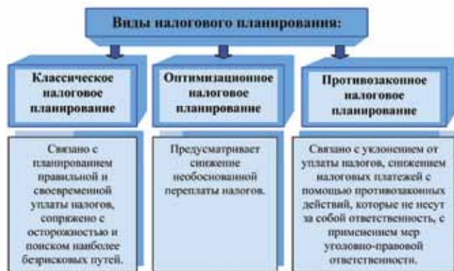
Рис. 1. Виды налогового планирования

Классификация видов налогового планирования, представлена на рис. 1.