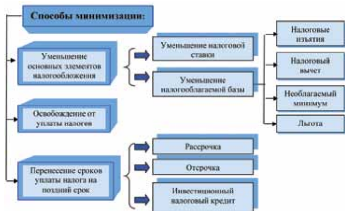
Рис. 2. Способы минимизации налогообложения

Функции налогового планирования заключаются в выявлении и учете факторов, обеспечивающих минимизацию величины налоговых обязательств, что позволяет влиять на показатели прибыльности и рентабельности. Минимизация налогов представляет собой абсолютное уменьшение налогов, а также деятельность, имеющую целью перевод промышленного предприятия в более выгодные условия хозяйствования. Способы минимизации налогообложения представлены на рис. 2.