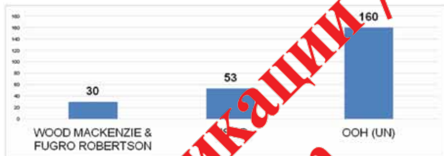
Рис. 1. Оценка запасов первичных углеводородных ресурсов в Арктике, млрд. TOE (billion of oil equivalent) [31, 32, 33]

позволило обеим странам приступить к разработке нефтегазовых месторождений на шельфе. Очевидно, что успешное решение текущих споров вокруг приарктических и арктических территорий позволит странам «арктического клуба» активизировать свои усилия в области освоения Арктики и добычи первичных углеводородных ресурсов, запасы которых оцениваются на достаточно высоком уровне. Стоит, однако, отметить, что оценка запасов первичных углеводородных ресурсов Арктики далеко не однозначная, погрешность и вариативность прогнозов составляет более 100–130 млрд. тонн нефтяного эквивалента (рис. 1).