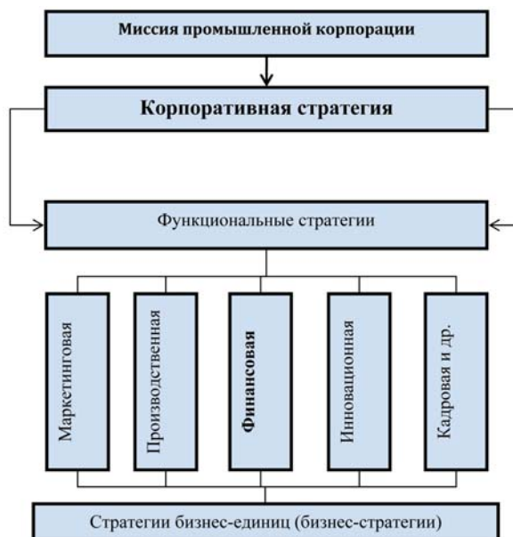
Рис. 2. Место финансовой стратегии в стратегическом наборе промышленной корпорации

Таким образом, с этой точки зрения можно определить место финансовой стратегии промышленных корпораций в совокупности функциональных стратегий, реализуемых в рамках основной (базовой) корпоративной стратегии (рис. 2).