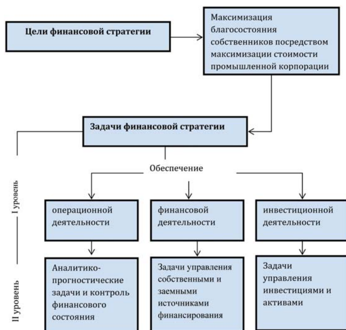
Рис. 3. Задачи финансовой стратегии промышленной корпорации

Стоит отметить, что показатель экономической добавленной стоимости является общепризнанным показателем, актуализирующим будущую стоимость промышленной корпорации [14, с. 54–56], а, следовательно, актуализирующим и все стратегические и тактические финансовые цели. На рис. 3 представлена декомпозиция задач финансовой стратегии промышленной корпорации в соответствии с целями стратегического финансового развития.