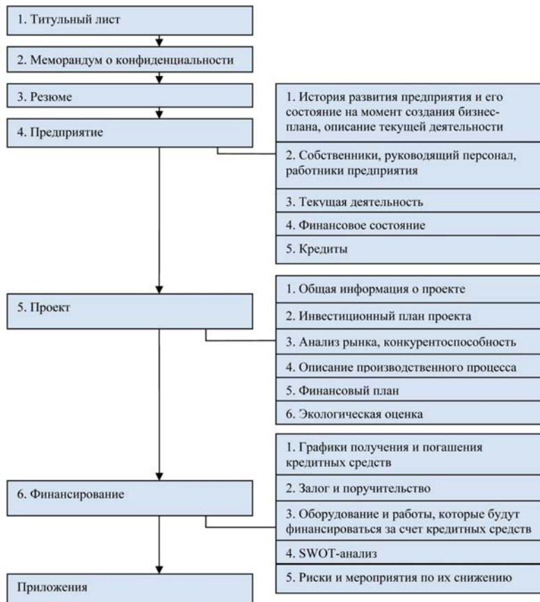
Рис. 2. Методика бизнес-планирования, предлагаемая ЕБРР [10]

Практически все методики по оценке инвестиционных проектов, существующие в мире на сегодняшний день, основываются на методике разработанной UNIDO еще в 70-х годах. Эта методика обеспечивает сбор всей необходимой информации для осуществления прогноза движения денежных средств, и для оценки проекта с использованием количественных показателей. Методика бизнес-планирования, предлагаемая ЕБРР (Европейский банк реконструкции и развития) имеет следующую структуру [10] (рис. 2).