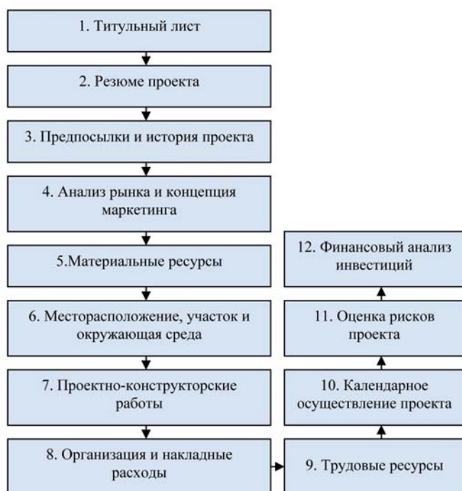
Рис. 1. Структура инвестиционного проекта (UNIDO)