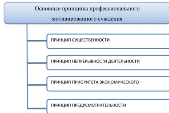
Рис. 1. Основные принципы профессионального мотивированного суждения

Так к основополагающим принципам профессионального мотивированного суждения можно отнести следующие (рис. 1).